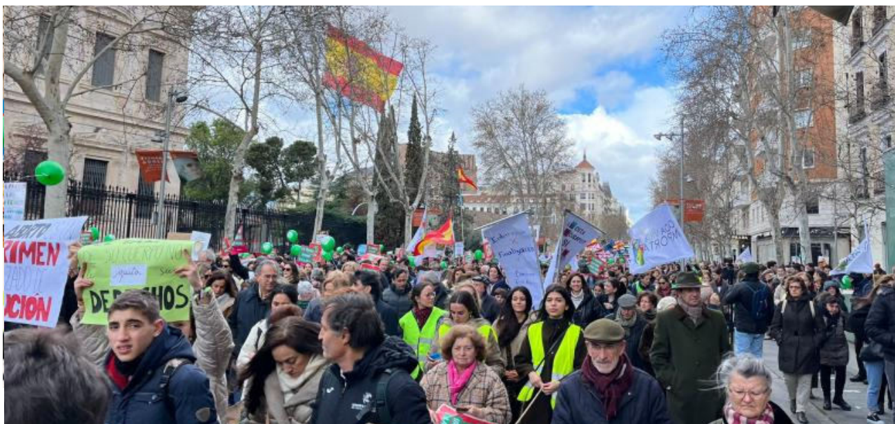
Manifestación "Sí a la vida" en Madrid

El domingo 10 de marzo se celebró en Madrid una manifestación provida . Miles de personas marcharon «a favor de la vida» y contra la «cultura de la muerte».