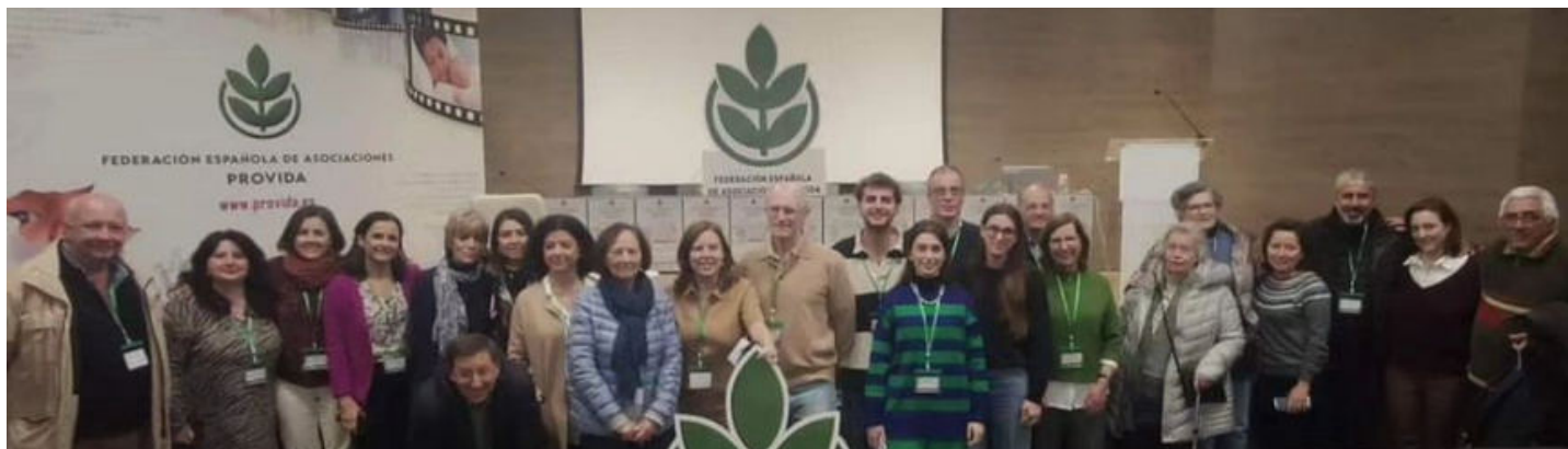
Participantes del congreso

Organizado por la Federación Provida , con la colaboración del Centro de Estudios Universitarios (CEU) y la Asociación Católica de Propagandistas (ACdP) y bajo el lema “El bien siempre vence” , ha tenido lugar en Madrid, los días 8 y 9 de marzo, el XXVI Congreso Nacional Provida .