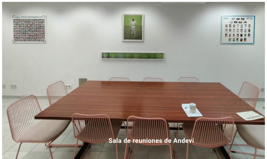
Sala de reuniones de Andevi