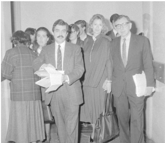
Bernard Nathanson en su visita a Pamplona

<<Como resultado de ese pensar acerca del aborto, y como resultado de eso, yo ahora se que no soy un conjunto de células sin sentido, simplemente moviéndose en un mundo oscuro. Los hombres, el ser humano, no es un animal de laboratorio que pueda ser manipulado por nuevos “sacerdotes” de esa ciencia.>>