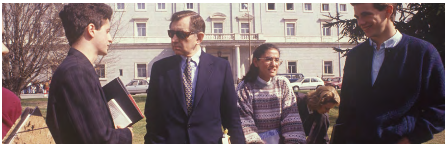
Bernard Nathanson en su visita a Pamplona

"Si calláis o no hacéis algo para quitar esta ley (del aborto), el final será tal abuso y tal negación de la vida, que no se podrá vivir en una sociedad civilizada. El final lógico del aborto es este estado de marasmo, es facilitar la matanza de niños vivos, la destrucción de gente anciana, la destrucción de gente que está padeciendo enfermedades crónicas y la destrucción de cualquiera que sea físicamente imperfecto. Al final, la destrucción de cualquier persona que tenga que vivir del dinero del gobierno o de la sociedad. Esto es porque el aborto es sólo el inicio de una posible aniquilación de todos aquellos que no son capaces de cuidarse a sí mismos"