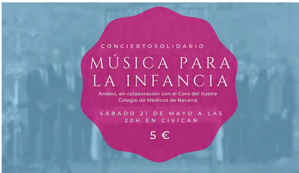
Coro del Colegio de Médicos

Andevi , en colaboración con el Coro del Ilustre Colegio de Médicos de Navarra , ha organizado un concierto solidario para recaudar fondos que nos permitan seguir ayudando a los diferentes colectivos de exclusión social con los que trabajamos (Desde la Infancia hasta la Tercera Edad).