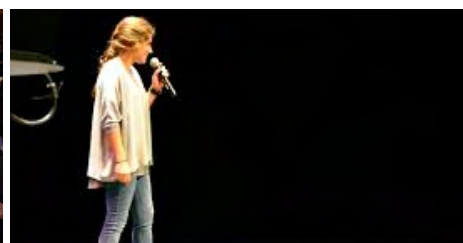
Imágenes del congreso internacional de Provida organizado por Andevi