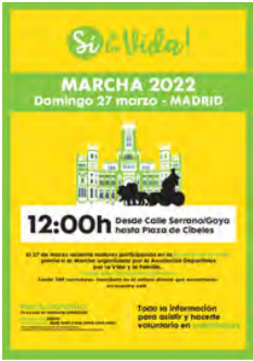
Cartel de la marcha por la vida

Después de dos años de pandemia volvió a celebrarse la marcha: Sí a la vida . Tuvo lugar el 27 de marzo a las 12 am en Madrid . ANDEVI se sumó a esta iniciativa junto a otras 500 asociaciones de toda España.