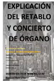
Cartel del evento