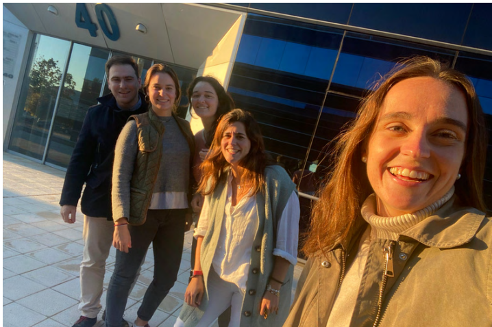
Coordinadores de 40 días por la vida

Una campaña cuyo fin principal es acabar con el aborto a través del arma más poderosa: la oración. Tú te pones frente al abortorio, a una distancia considerable de la puerta. Y de forma pacífica oras e intercedes. ¿Qué es eso de interceder? Nos unimos en oración para pedir en favor de las madres, el bebé, los padres, los médicos, las enfermeras, los legisladores... Esta vez vas a por todos. Porque quieres el bien de todos.