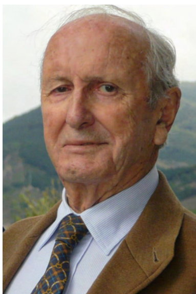
José Luis Solchaga

El pasado miércoles, 12 de agosto y tras un largo proceso de enfermedad, falleció en Pamplona D. José Luis Solchaga Sagüés.