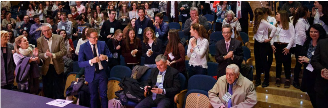
Homenaje al Dr. Miranda en el Congreso Nacional de Asociaciones Provida organizado por los jóvenes de ANDEVI

Sólo he tenido el honor de tratarle en los últimos once de los noventa y dos años de su vida, culminada con las botas puestas, dedicada al servicio de Dios y de los débiles.